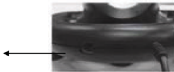
Порт ножной педали